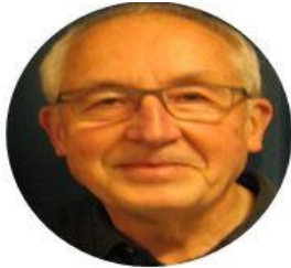
Rudi Völler Vorsitzende