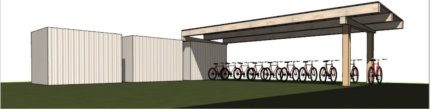
Abb.1: Variante 1 Überdachung im hinteren "Garten-/Spielplatzbereich"; Einmal seitlich auf vorhandenem Container aufliegend und einmal Lastabtragung über Stützen bzw. Bohrfundamente